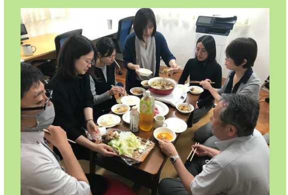
繁忙に向かうエネルギーチャージ