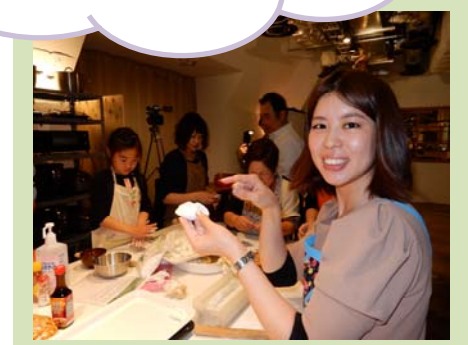
社員の家族も一緒に創作料理