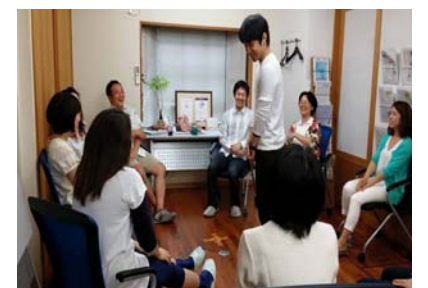
ミーティング席決めゲーム