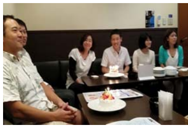
外部コンサルタントを 招いての Beer ミーティング