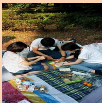
屋外で チームビルディング