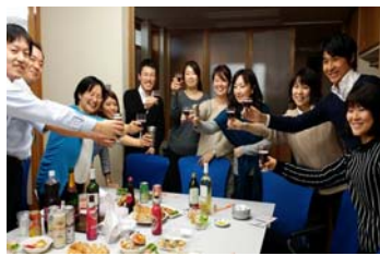
忘年会などの季節行事