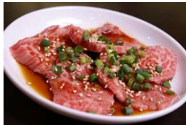
希少部位！ともさんかく

今月は5周年を迎えたばかりの焼肉店「炭焼喰人(株式会社TAN様)」をご紹介します。炭焼喰人といえば、「長期低温熟成の赤身肉」・「かたまり肉」・「地産地消☆都筑野菜」。肉の旨みがグッと増すよう低温で保存熟成させた牛肉を、お客様からのご希望によりかたまりで出して下さるお店です。「イチボ(※1)」「ともさんかく(※2)」etc.希少部位も日替わりでサービス価格に